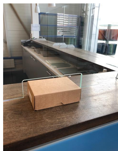
Durchreiche auf Wunsch Grösse nach Ihren Angaben