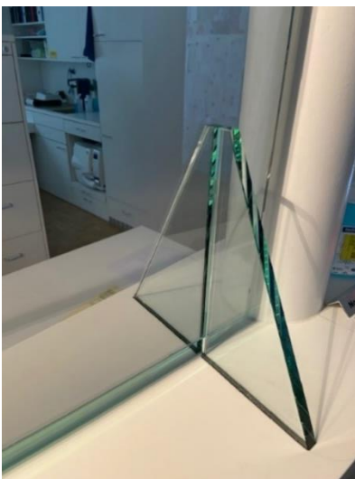
Glasfüsse mit Filz